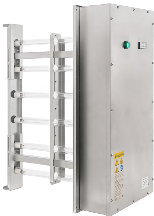
Modello UL Listed

La serie UV-RACK comprende una serie di moduli, di diverse dimensioni e potenze, tutti in acciaio INOX AISI 304. Le lampade UV-C sono equi-distanziate tra loro e posizionate in modo da creare una griglia attraverso la quale l'aria è costretta a passare una volta montato l'apparecchio nelle condotte principali.