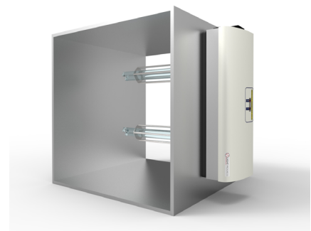
Esempio di applicazione in una condotta