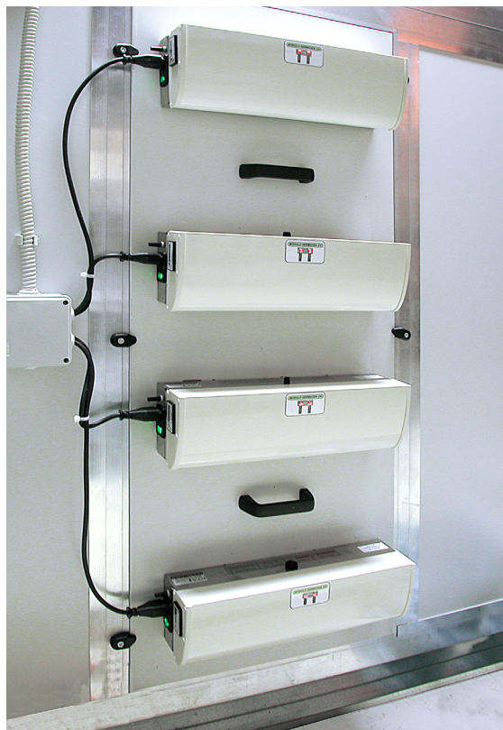
Applicazione in UTA

La serie UV-DUCT-FL comprende una serie di moduli a flangia da cui fuoriescono due lampade a "U" di diverse lunghezze (da 20 a 50 cm) e potenze (da 70 a 190 W), protette da una griglia Inox.