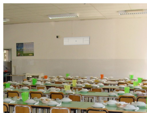
Esempio di applicazione

La tecnologia UV-C è un metodo di disinfezione fisico con un ottimo rapporto costi/benefici, è ecologico e, al contrario degli agenti chimici, funziona contro tutti i microrganismi senza creare resistenze.