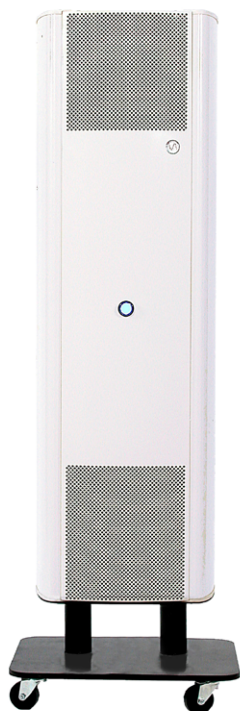
Modello su ruote (-ST)

La serie UV-FAN comprende una vasta gamma di purificatori da parete o su ruote (modello -ST), diversi in base alle potenze UV-C della lampade e alle dimensioni.