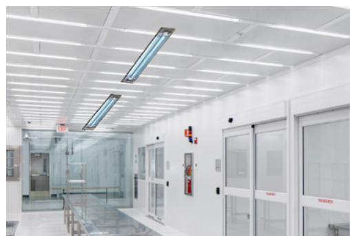
Applicazione in un ambiente industriale

La tecnologia UV-C è un metodo di disinfezione fisico con un ottimo rapporto costi/benefici, è ecologico e, al contrario degli agenti chimici, funziona contro tutti i microrganismi senza creare resistenze.